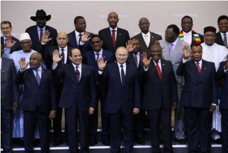
Afrikanske statsledere sammen med Ruslands præsident Vladimir Putin til det russisk-afrikanske topmøde i Sochi i 2019.

ANALYSE: Rusland og Vesten kæmper om magt, indflydelse og allierede på det afrikanske kontinent. Men måske aflæser de Afrika anno 2022 forkert. Det betyder, at de begge kan komme til at stå tilbage med mindre magt og indflydelse og færre allierede.