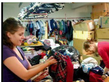
Tøjsortering i et fransk Emmaus-samfund

Hver sommer arrangeres klunserlejre med indsamling, sortering og salg rundt om i Europa. I enkelte tilfælde kan der blive tale om andre arbejdsopgaver, f. eks. gartneri og byggeri.