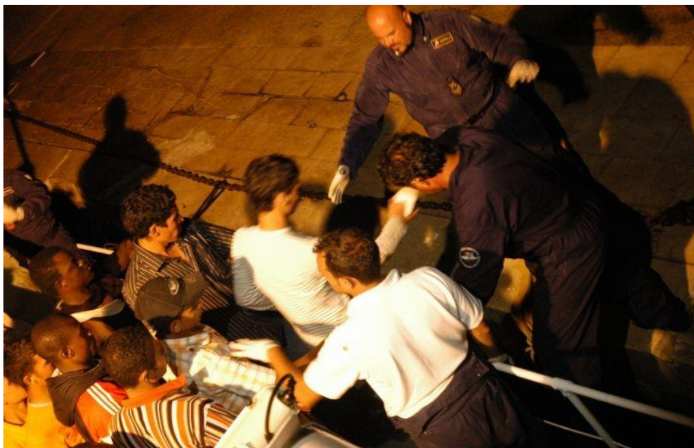
Fra den italienske middelhavsø Lampedusa, hvor migranter forsøger at komme i land (foto: Fotografen er ukendt, og billedet stammer fra hjemmesiden www.everystockphoto.com , fra hvilken det er gratis at benytte billederne. Emmaus International har foreslået billedet og dem på henh. side 1 og side 13)