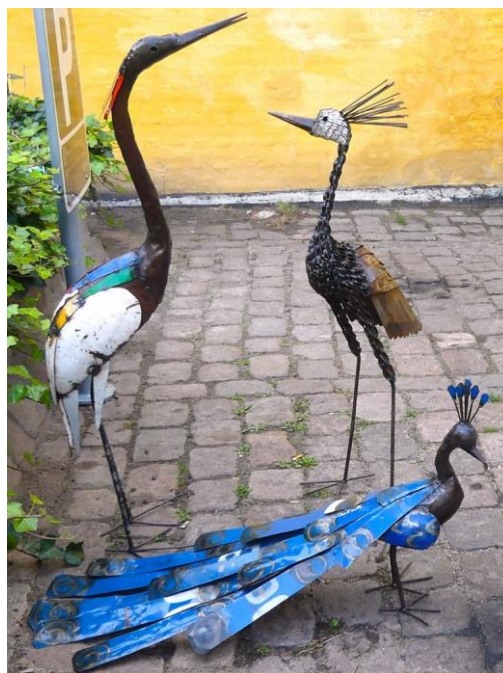
De tre store fugle omtalt i venstre spalte

Mange af Genvej til Udviklings læsere kender sikker det gamle afrikanske spil Oware. Det kan man få i Fair Trade Bazaren sammen med en vejledning i hvordan spillet spilles. De er lavet af oframtræ og fremstilles hos andelsforeningen Kalangu Projects i Accra, Ghana. Importeres af www.el-puente.de .