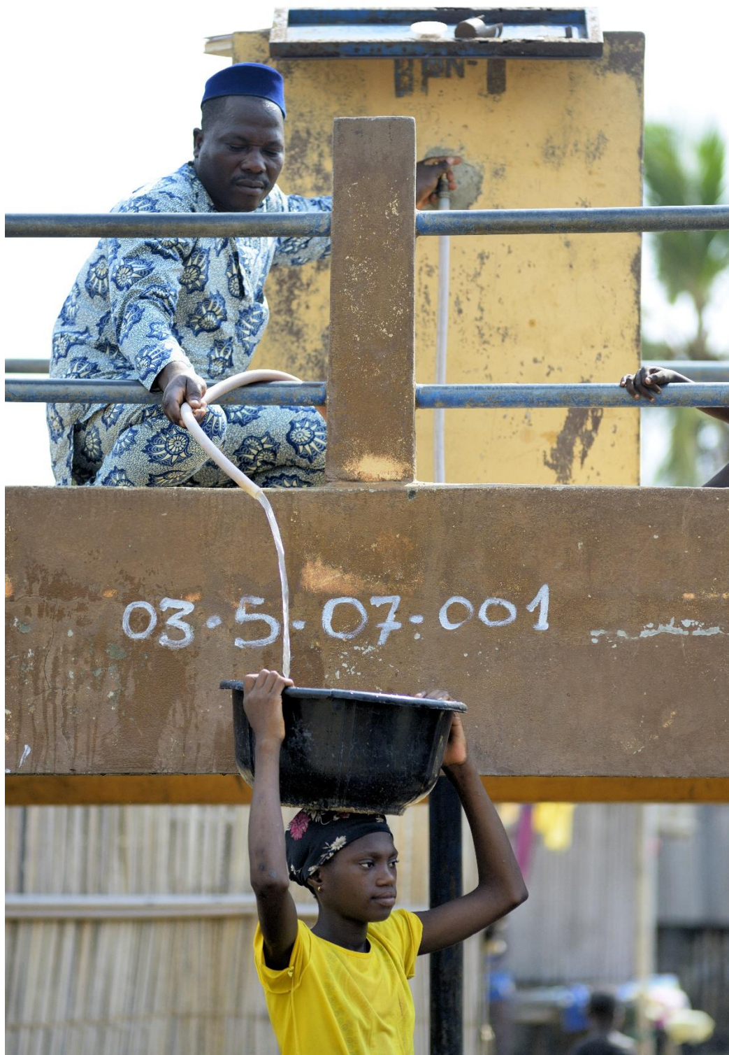
En hane med slange i vandprojektet i Nokoué-Sœn i Benin