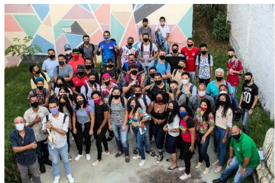
Eleverne på skolen Emaús – Luis Tenderini 1 Recife, Brasilien

Allerede med hensyn til den anden fordring støder vi igen på noget, der er typisk for Emmaus, nemlig lysten til at se og forstå de konkrete tiltag i den større samfundsmæssige sammenhæng, i en perspektivering som også prægede Abbé Pierre’s trang i de første tider i 1950’erne. Og som igen bygger på en stærk tro på alle menneskers ressourcer.