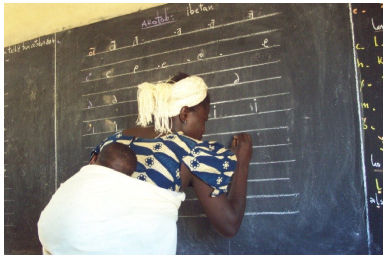
Bogstaverne øves