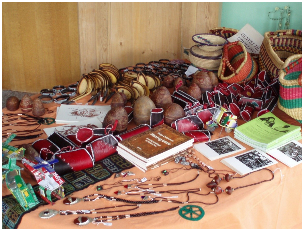
Den blandede u-landshandel

håndværksprodukter produceret af vores samarbejdspartnere i Niger og Burkina Faso mv. Målet er at skaffe et indtægtsgrundlag til producenterne, som typisk udgøres af fattige håndværkere. Samtidig ønsker vi at oplyse om producentfamiliernes levevilkår og vise, at mennesker i u-lande er både kreative og handlekraftige.