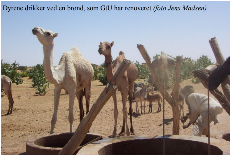
Dyrene drikker ved en brønd, som GtU har renoveret