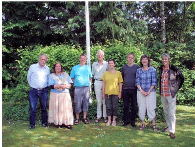
Fra generalforsamlingen 2011

Herved har vi været med til at give mange mennesker en bedre hverdag med fokus på, at det ikke er nødhjælp, med