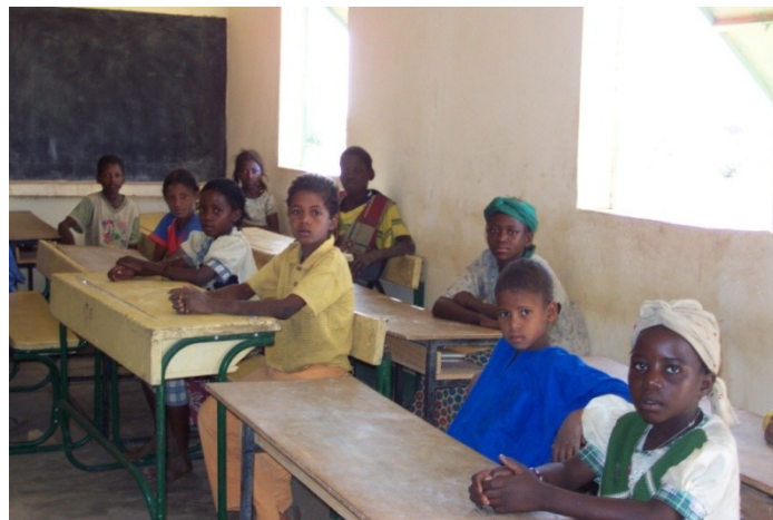
Er gæsten virkelig så interessant...

Skolens lærere er heldigvis motiverede, og skolen leverer god undervisning ifølge myndighedernes pædagogiske tilsyn. Skolen har derfor let ved at tiltrække nye elever, der i reglen gennemfører den seksårige grundskole. Dog er det svært at fastholde de dygtigste elever i skolesystemet, da der mangler en mellemskole i nærområdet. Mange af de elever, der videreuddanner sig i nabokommunerne, stopper nemlig før tid, da børnene ofte lever under usle vilkår og savner deres familier.