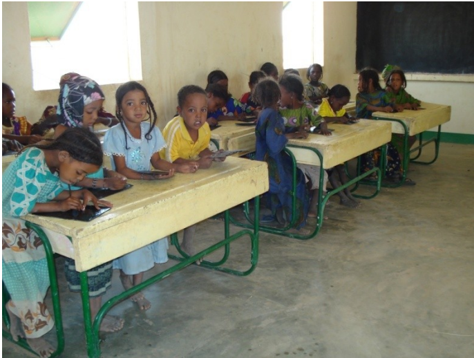
Der terpes og lyttes

I Danmark skændes politikere og borgere bravt, når talen falder på modersmålsundervisning på andre sprog end dansk. For kan de tosprogede skolebørn nu også efterfølgende integreres i det danske samfund? Sådanne overvejelser gjorde vi os ikke i GtU, da Kooperativet i Amataltal spurgte, om vi ville samarbejde omkring etablering af en tosproget skole i Amataltal.