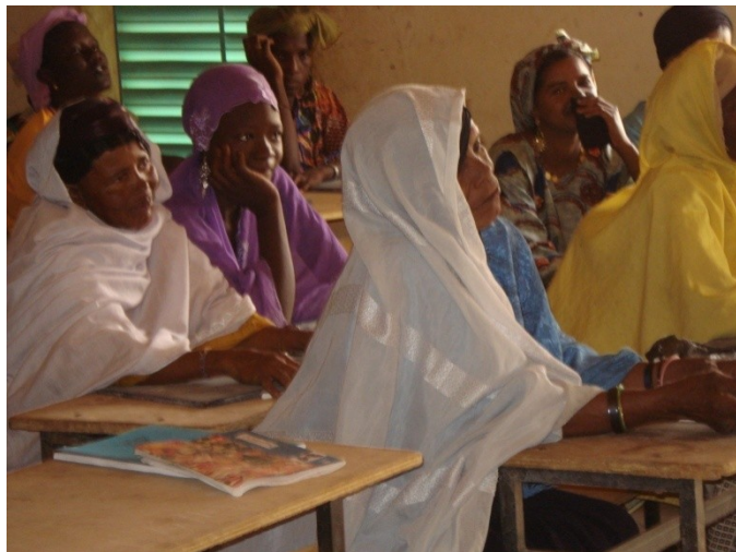
Det er aldrig for sent at få det lært