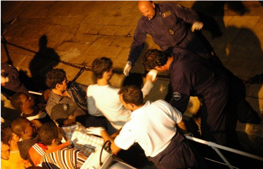
Fra den italienske middelhavsø Lampedusa, hvor migranter forsøger at komme i land