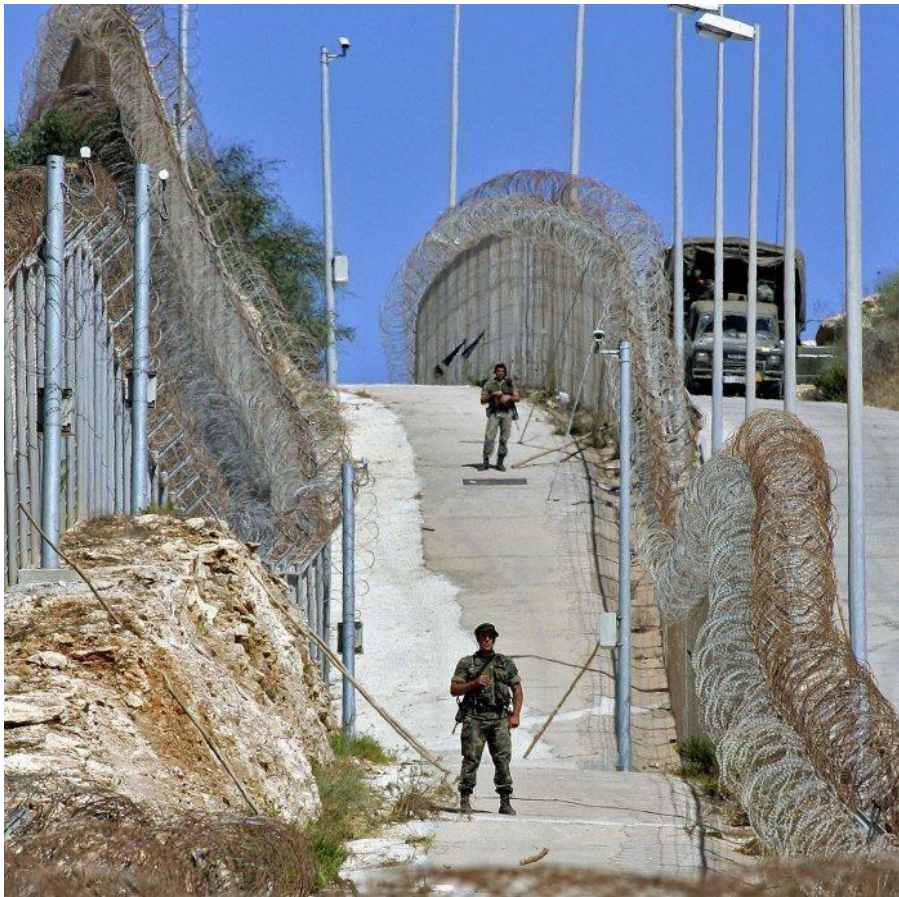
Fra den spanske enklave Ceuta, som er omkranset af Marokko

En vidt udbredt falsk forestilling: “Hvis folk har det godt i deres eget land, emigrerer de ikke. Jo rigere, des mindre udvandring. Rigdom og uddannelsesniveau favoriserer geografisk stabilitet. Derfor: Det er nok at støtte den 3. verden økonomisk for at undgå udvandring.”