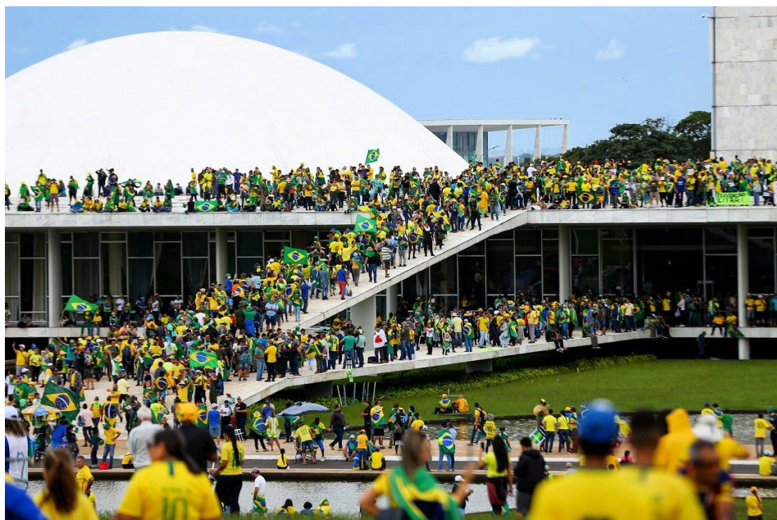
Bolsonaro-tilhængere besatte et stort antal offentlige bygninger