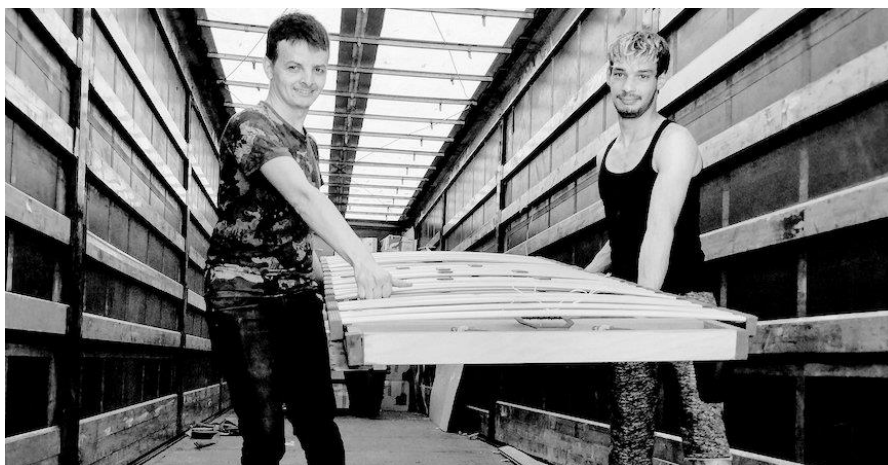
To unge medlemmer af Emmaus Satu Mare aflæsser en container, sendt fra Emmaüs Chaux de Fonds, Schweiz, maj 2022