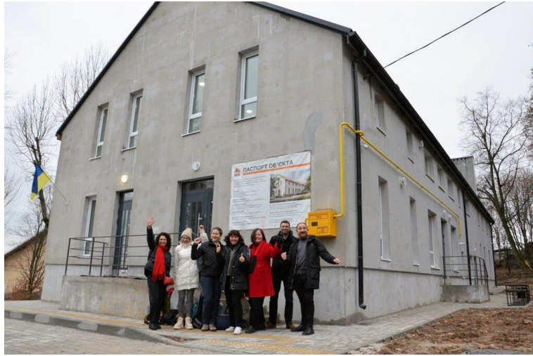
Det nye socialcenter fejres