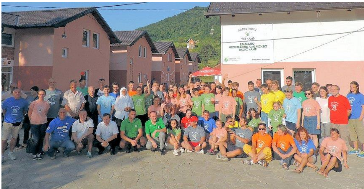
Deltagerne i lejren i Srebrenica, Bosnien-Hercegovina, i 2019