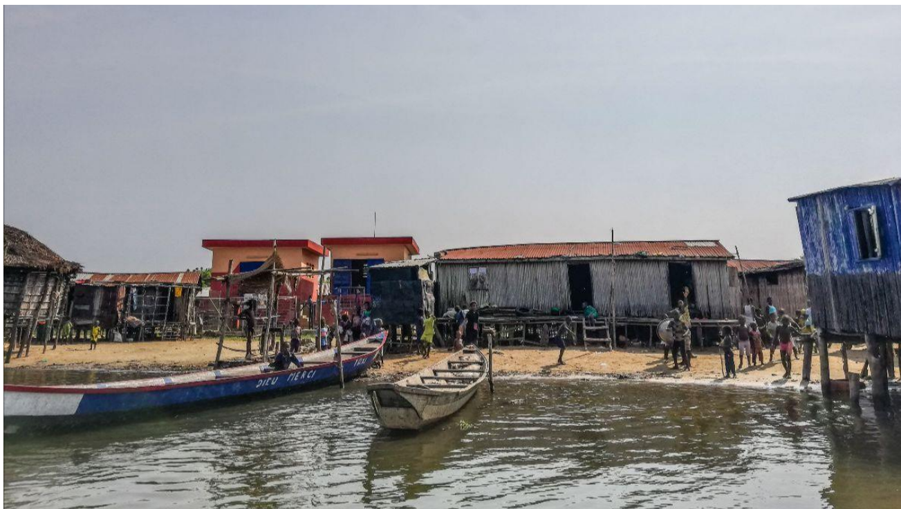
Typisk billede fra Nokoué-Søen