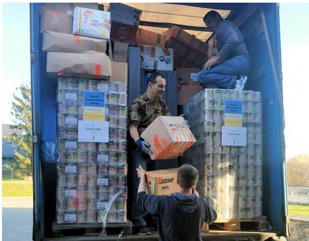
D. 3. november 2022 blev en lastbil med humanitær nødhjælp læsset hos Emmaus Rzeszow i Polen og sendt til Emmaus-Samfundet Nasha Khata i Ukraine

Ydermere vil gruppen blive tildelt et beløb på 15.000 euro, så den kan finansiere købet af en minibus, der er i bedre reparationstilstand, hvilket gør det muligt for gruppen at foretage dens hverdagsarbejde.