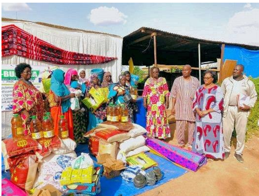
Uddeling af nødforsyninger til interne flygtninge i Burkina Faso