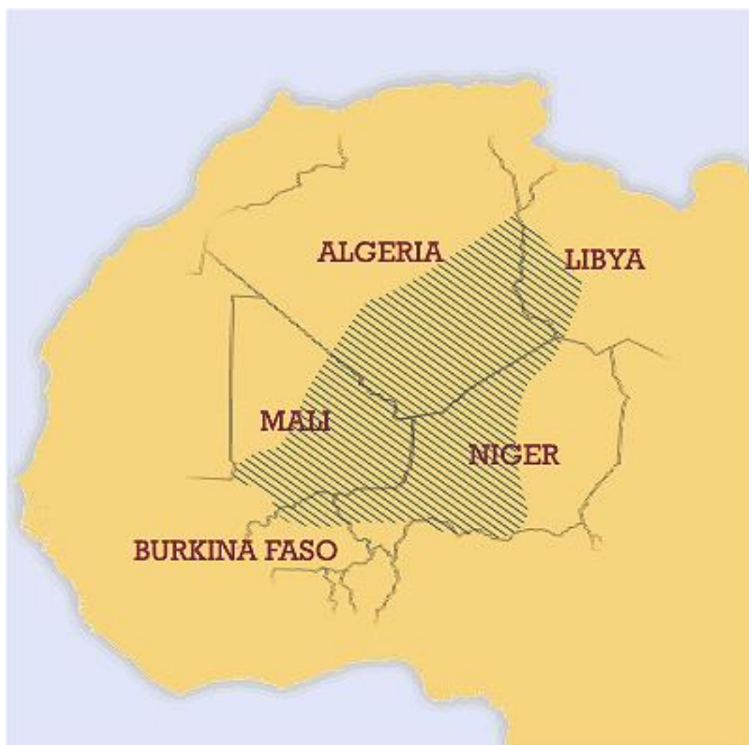
”Tuaregland” i skravering. Agadez ligger under I’et i Niger.