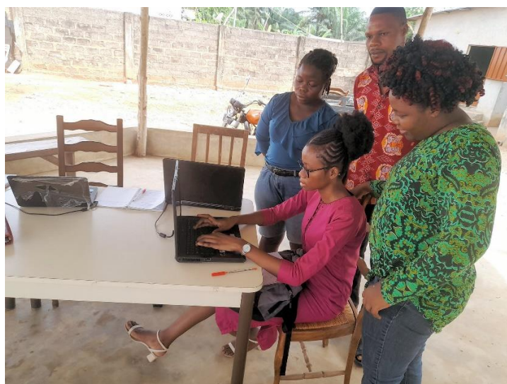
En af de organisationer, vi sælger varer fra, er Emmaus-medlemmet AFA i Benin, jf. AFA_da.pdf (gtu.dk) Her er AFA i gang med et kursus i informationsteknologi

Der var tale om en meget gammel aftale med Pag-la-Yiri, indgået før coronaen.