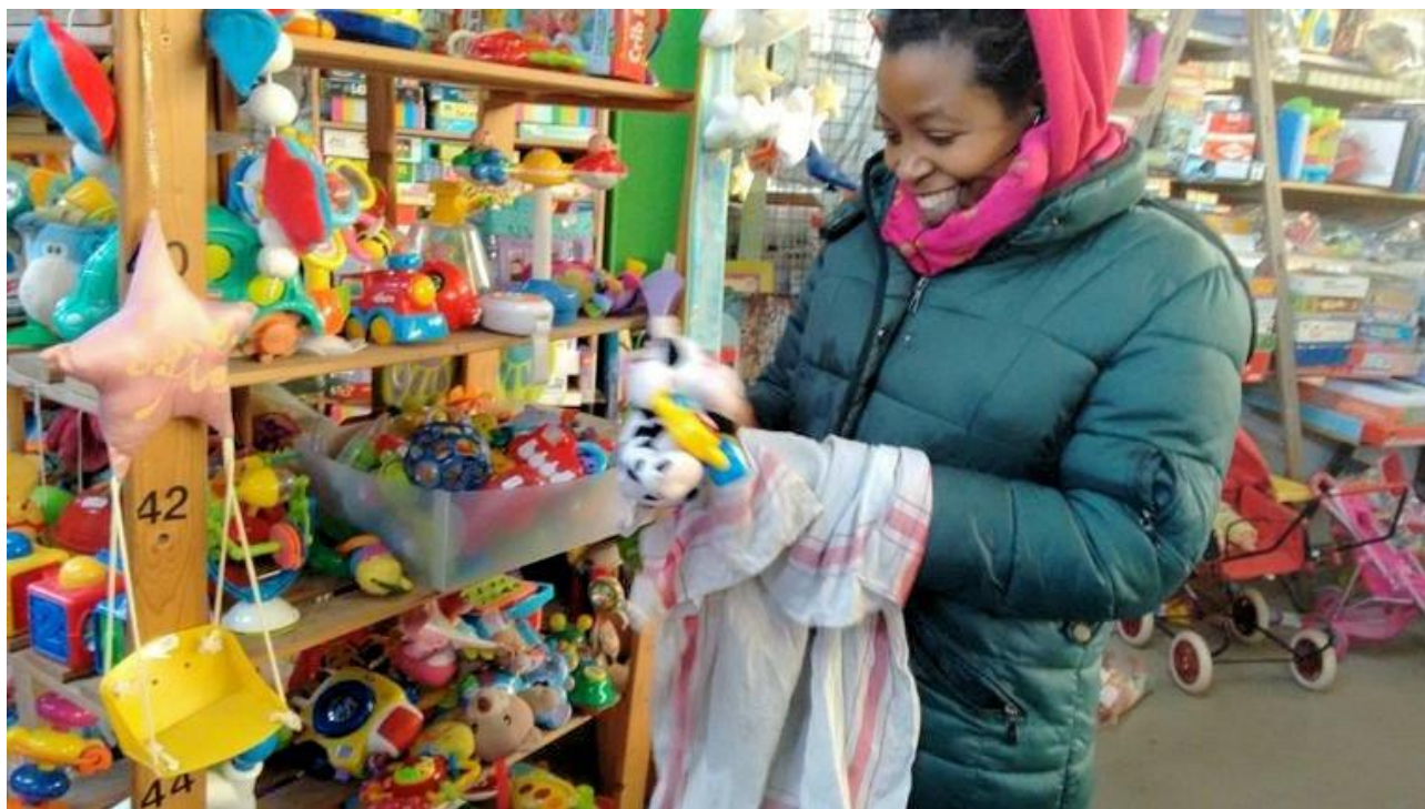
En klunser kan blandt meget andet blive sat til at sortere legetøj