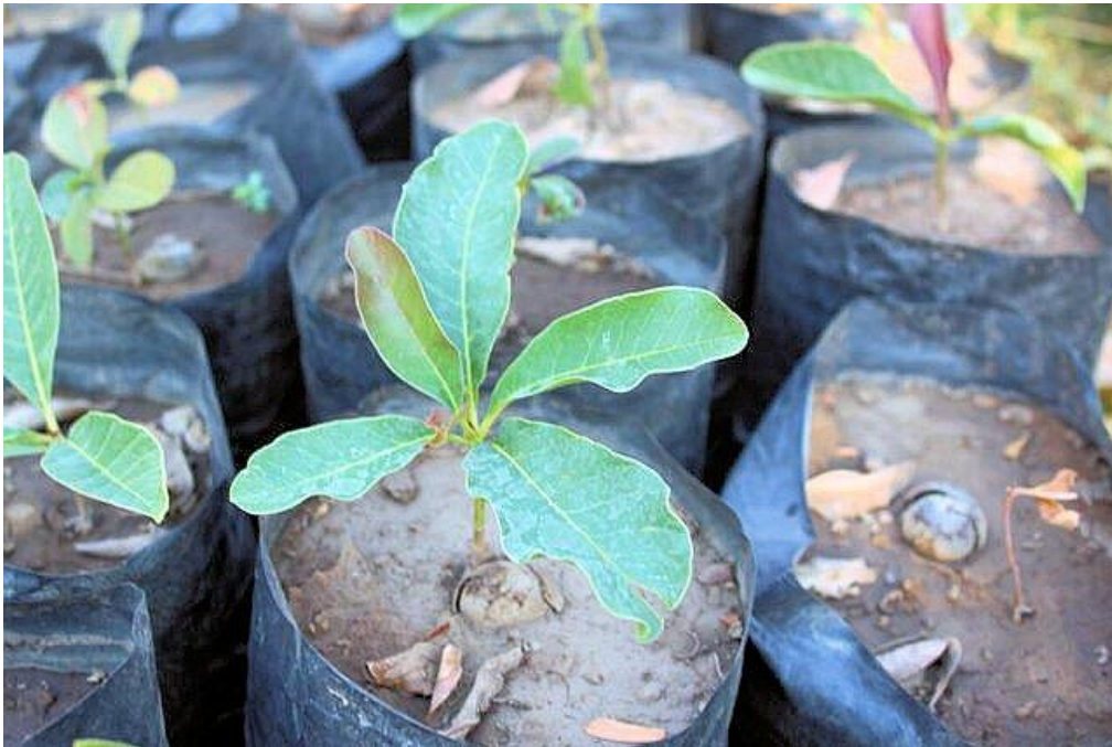
Et udsnit af sheatræerne