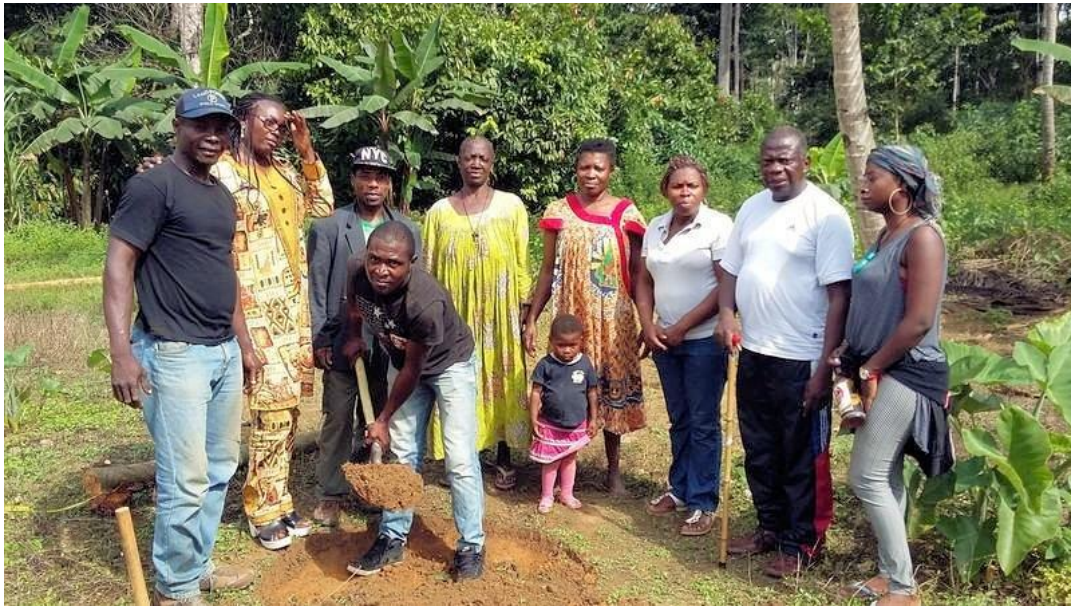
CPSS – medlem af Emmaus