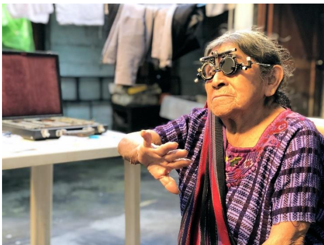
Syn for Sagen har været i mange lande – dette billede er fra Guatemala

Hvad er vores drivkraft til at blive ved?