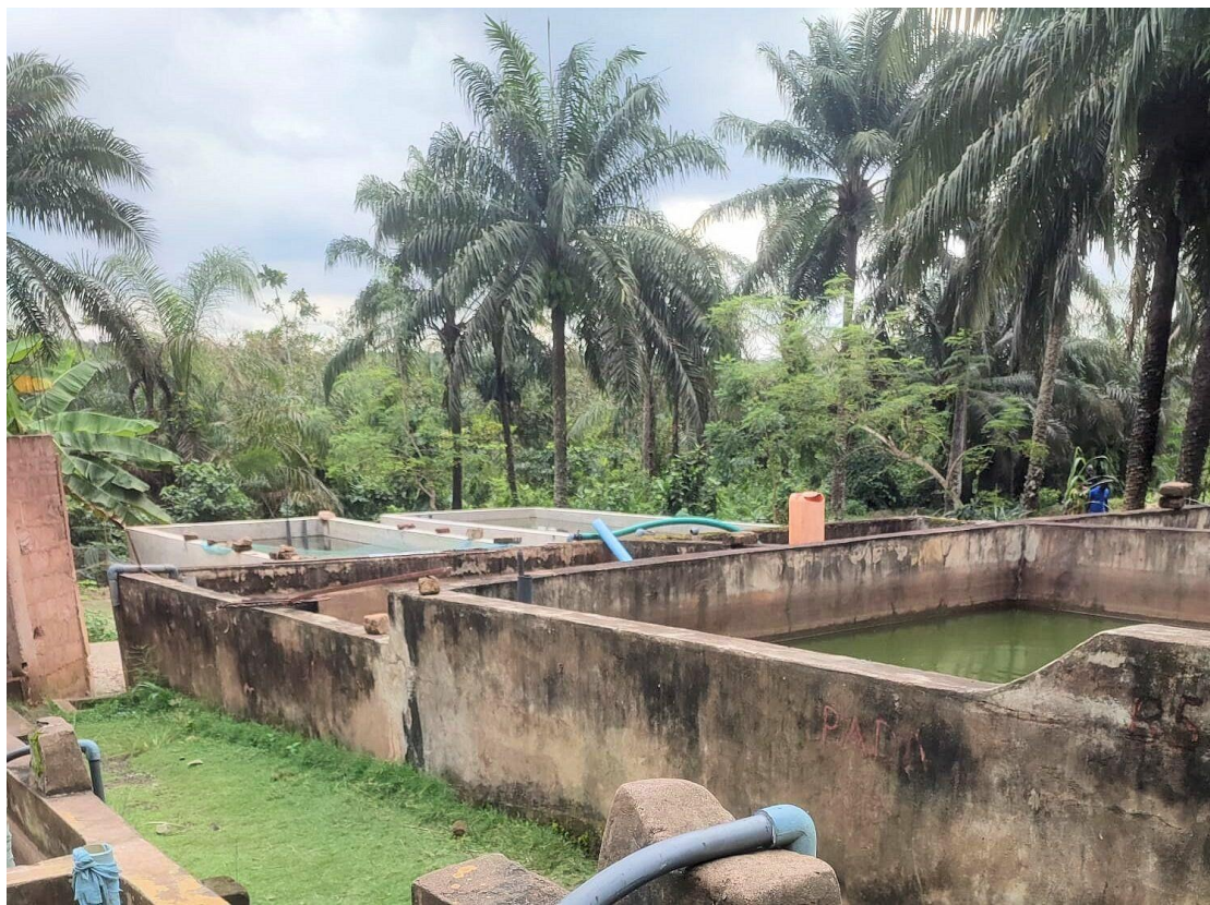
Bassiner og palmer hos Emmaüs Mobovome